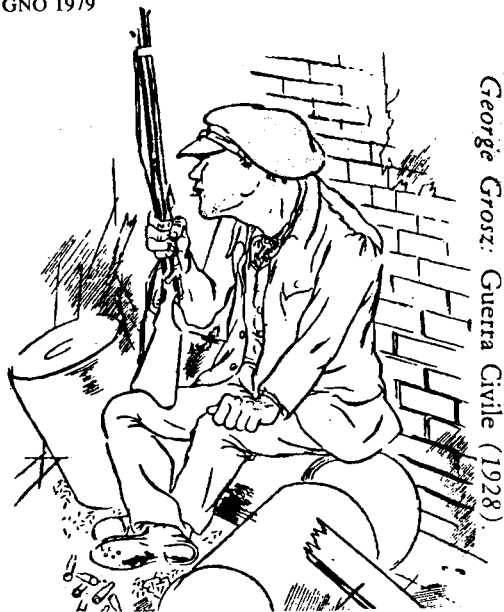
George Grosz: Guerra Civile (1928)

Il carattere rettilineo e unilaterale, la rigidità e la fossilizzazione, il soggettivismo e la cecità soggettiva, voilà le radici gnoseologiche dell'idealismo.