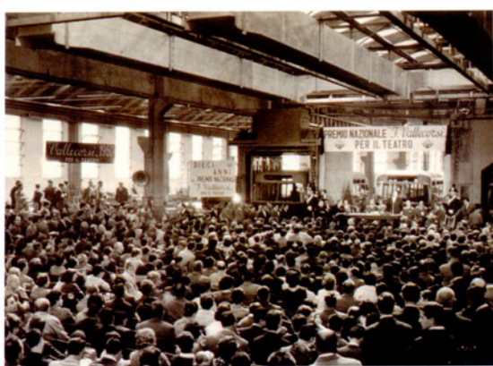
A fianco: Edizione 1960. Sotto: l'attore Cesare Polacco.