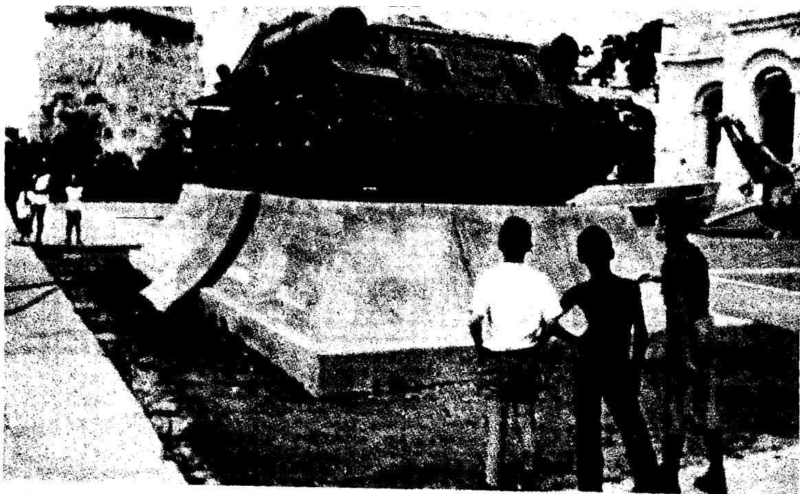
Un carro armato dell'Unione Sovietica esposto al Museo della Rivoluzione all'Avana.