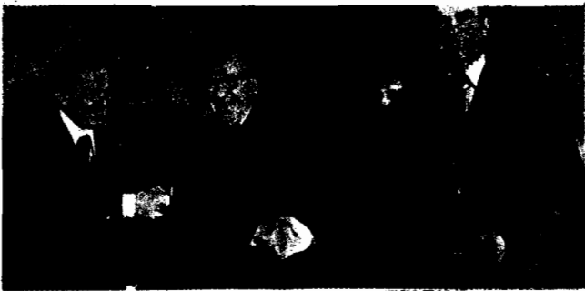
Berlinguer, Carrillo e Marchais