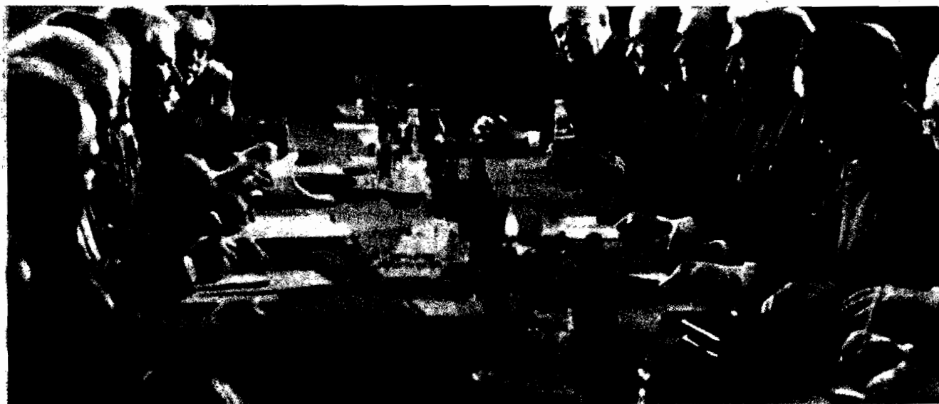
Cyrus Vance e Leonid Breznev durante i colloqui di marzo a Mosca

“Corrispondenza Internazionale” pubblica ampi estratti di un articolo dedicato alla campagna di Carter sui “diritti umani”, apparso nel numero di aprile di “Revolution”, organo del Revolutionary Communist Party degli Stati d'America. Nel prossimo numero torneremo ampiamente sull'argomento, pubblicando una dettagliata analisi dei comunisti americani su “La reale dinamica della corsa agli armamenti”.