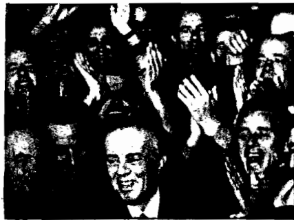
Il segretario generale del PLA, Enver Hoxha

Cari compagni e compagne deputati, il Comitato Centrale del Partito del Lavoro d'Albania e la commissione speciale istituita da questa Assemblea per la redazione del Progetto della nuova Costituzione della Repubblica Popolare Socialista d'Albania, mi hanno incaricato di presentarvi, a loro nome, il progetto definitivo della nuova legge fondamentale del nostro Stato socialista, che voi avete l'onore e la grande responsabilità di discutere e approvare. Dopo la stesura del progetto iniziale, proclamato dall'Assemblea Popolare