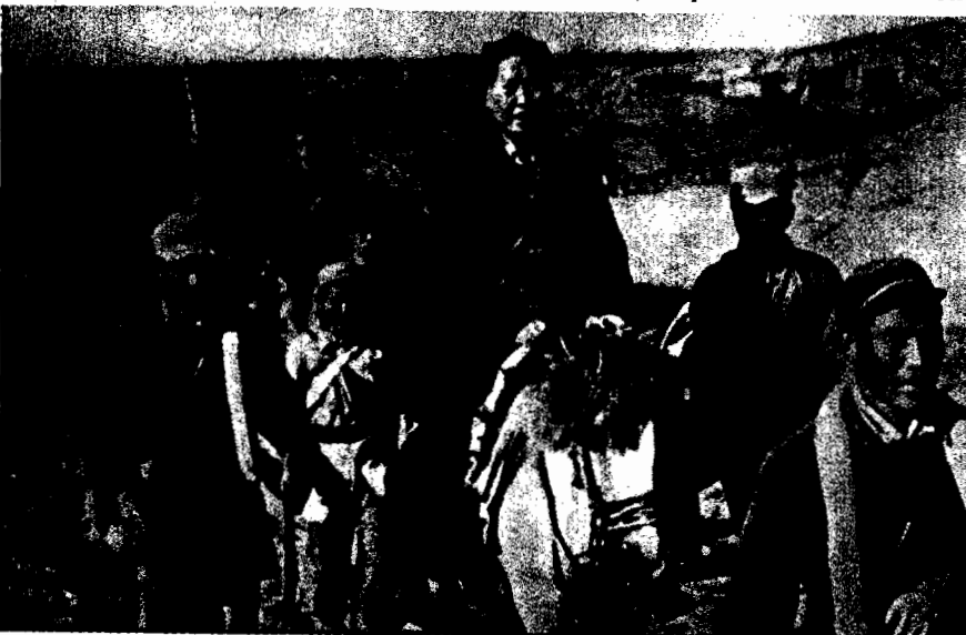
Il presidente Mao durante la lunga marcia.

Rimane il fatto che la crisi di ottobre, sia per il modo in cui è stata consumata, sia per i contenuti politici che si stanno affermando nella linea dominante, sia per i problemi non risolti al vertice del partito e dello stato, sia per i ripetuti appelli alla disciplina e per notizie di interventi repressivi, sembra indicare un profondo mutamento rispetto al "permanetismo dialettico" di Mao, in particolare del Mao indicatamente antirevisionista degli ultimi vent'anni. E' singolare a questo riguardo il tentativo dell'attuale gruppo dirigente, comprendosi sistematicamente con Mao, di richiamarsi, anche in una chiave interpretativa contestabile, agli scritti di