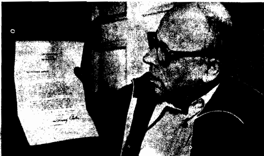
Andrei Sakharov con la lettera inviata da Carter

Probabilmente il gruppo più attivo di questo genere di dissidenti intellettuali è in Cecoslovacchia, dove recentemente 500 persone hanno firmato e distribuito un manifesto, chiamato Carta '77, che elenca le violazioni del governo cecoslovacco degli Accordi di Helsinki sulla libertà d'espressione, educazione, parola, sulla libertà di avere la stampa occidentale, ecc. Carter ricorda certamente molto bene la sfida all'egemonia sovietica nell'Europa dell'Est che si levò in Cecoslovacchia nel 1968. In nome della liberalizzazione, il Partito Comunista Cecoslovacco, che aveva abbandonato