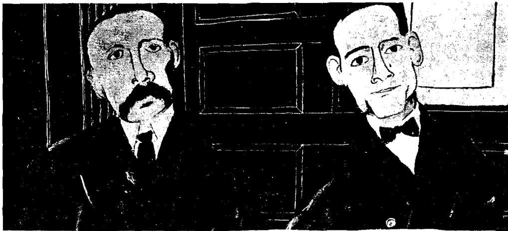
Bartolomeo Vanzetti e Nicola Sacco

Ecco quindi un altro magnifico esempio di ciò che accade quando la circolazione viene sostituita alla produzione come essenza delle relazioni capitalistiche.